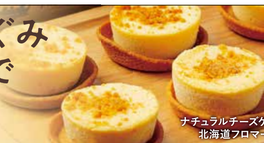
ナチュラルチーズケーキ 北海道フロマージュ

北海道・十勝の中心地、帯広にある菓子店です。地元の豊かな食材を使ったスイーツをどうぞ。