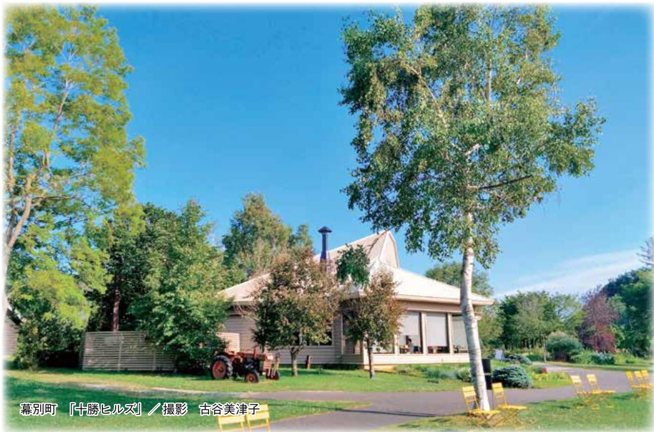
幕別町「十勝ヒルズ」