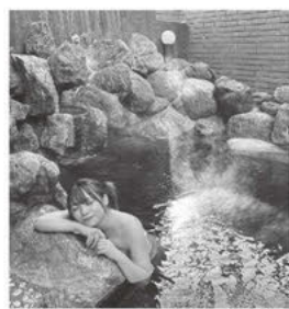
モール温泉は「美人の湯」として親しまれています

ばんえい競馬、豚丼、スイーツ等と共に、地域に愛され日常に溶け込んでいる「モール温泉」は帯広の文化です。「温泉総選挙2021」への入賞を追い風と捉え、引き続き「帯広温泉郷」の魅力発信していきます。