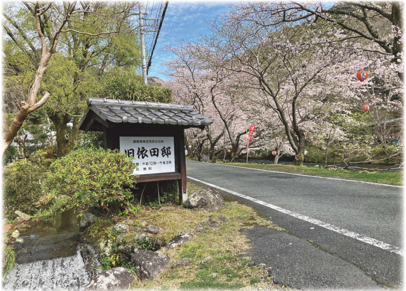
静岡県松崎町 旧依田邸前の桜