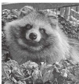
紅葉に埋もれるエゾタヌキ

関東にお住まいの皆様もツイッターを通じて、当園の動物たちの姿をぜひご覧ください。なお、現在は新アカウント(@obizoo、official)に移行しています。