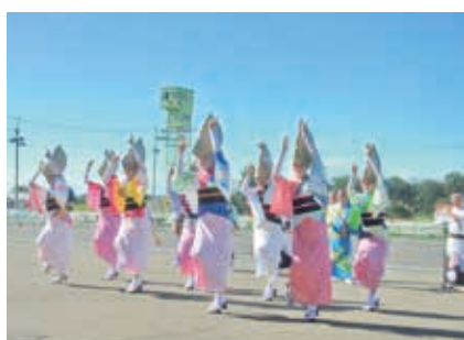
帯広競馬場で阿波おどりを披露する親善訪問団

今回はこの大会参加だけでなく、帯広競馬場でもその卓越した技量を余すところなく発揮していただき、会