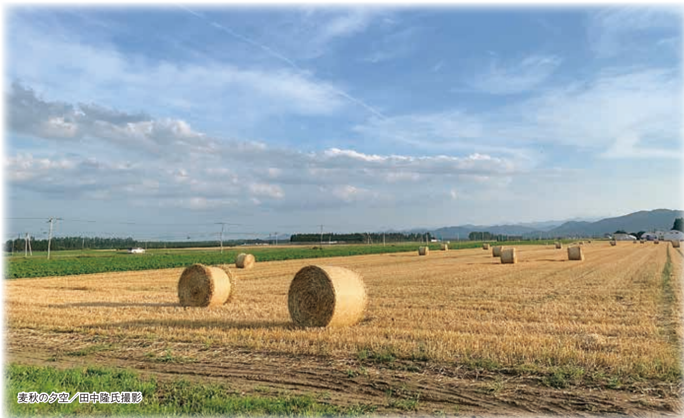
麦秋の夕空