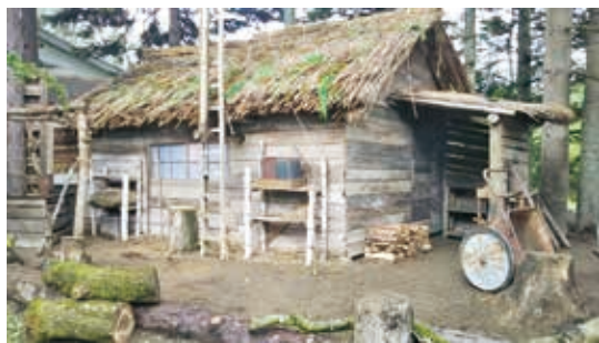
真鍋庭園で公開している「天陽の家」のセット

柵などを11月末までの公開予定としており、ドラマのイメージそのままの風景を楽しめます。さらに、柴田牧場の玄関と新牛舎のセットも、10月末まで公開される予定です。また、陸別町では、柴田牧場のサイロを道の駅前の多目的広場に移設し、9月頃に公開を開始します。十勝へいらした際はぜひ足をお運びいただき、「なつぞら」の世界をお楽しみください。