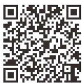
▲新ホームページ 二次元バーコード