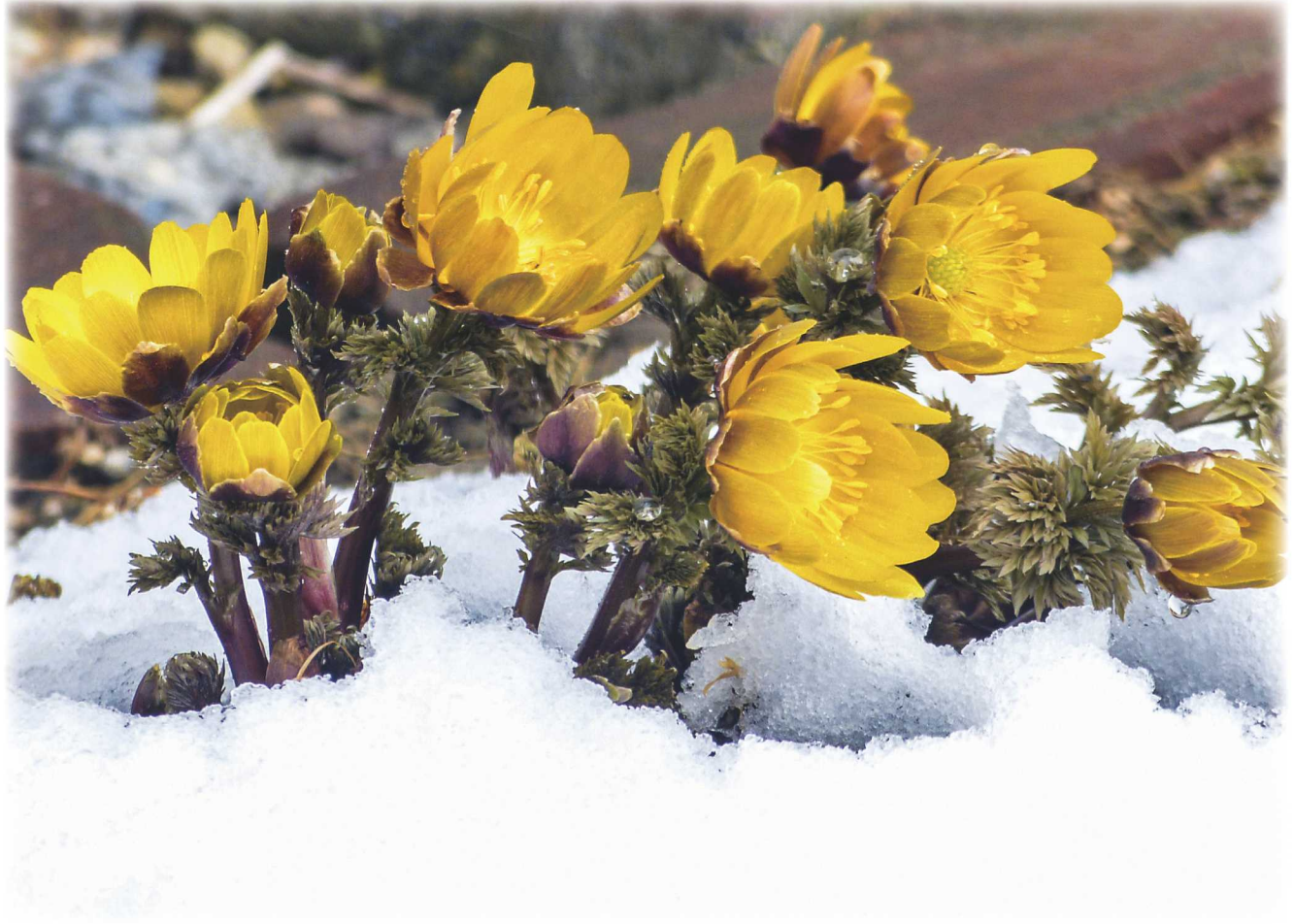
「春の訪れ」 幕別町在住 勝山衛氏撮影