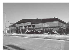
現在のとち帯広空港

現在では東京線と名古屋線(季節便)を運航しています。開港後は、滑走路の延伸や駐機場の拡張で、大型機の運航が可能となったほか、空港ターミナルビルの増設で、国内線と国際線の同時受け入れが可能になるなど、利便性が向上し、これまで2000万人を超える皆様に利用されてきました。 とち帯広空港では、3月から北海道内7空港の一括運営委託の運営者となった北海道エアポート(株)による運営を開始しました。今後は、民間事業者による7空港を核とした広域かつ効率的な運営により、とち帯広空港のさらなる活性化と利便性向上に取り組んでいきます。