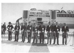
帯広-東京線▶ 初就航セレモニー